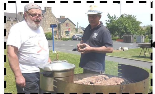
Une belle brochette de cuistots locaux!